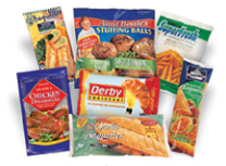
Frozen food bags