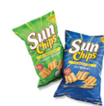
Bolsas de papitas