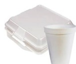
Empaque y envases de espuma de poliestireno