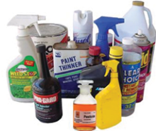
Hazardous & toxic product containers