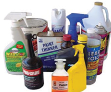
Envases de productos peligrosos y tóxicos