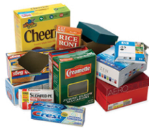
Chipboard, cardboard egg cartons, cereal & frozen food boxes