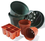
Rigid plastics, buckets & plant pots