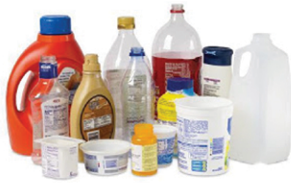
Plastic bottles, jugs & tubs plastic containers 1-7