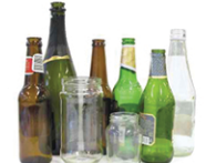
Glass food & beverage containers