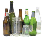
Envases de vidrio para bebidas y alimentos