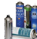
Latas de aerosol ¡SOLAMENTE VACÍO Y SIN PRESIÓN! (materiales no peligrosos)