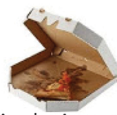
Cajas de pizza, cartón y papel encerado