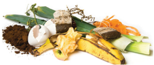
Food & wet waste, soiled paper plates & napkins