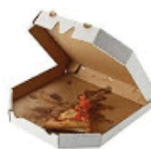
Pizza boxes & waxed cardboard & paper