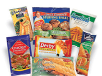
Bolsas de alimentos congelados