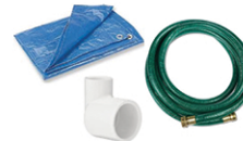
Lonas, mangueras y tubos de PVC