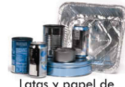
Latas y papel de aluminio, contenedores de metal