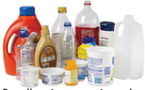
Botellas, jarras y tinas de plástico, contenedores de plastic #1-7