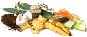
Desperdicios de comida, residuos líquidos, platos de papel sucio y servilletas sucias