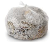
Shredded paper (place in clear plastic bag)