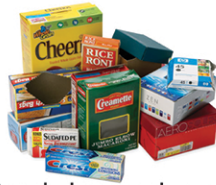
Cajas de huevos de cartón, cajas de cereal y alimentos congelados