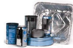
Aluminum cans & foil, tin & metal containers