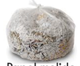
Papel molido (coloque en una bolsa de plástico transparente)