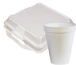
Styrofoam containers, packing material & peanuts