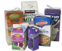
Cartones de leche, cajas de jugo y sopa