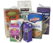
Milk, juice & soup cartons